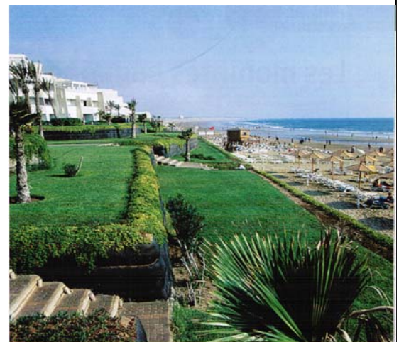
5 Un hôtel sur la plage d'Agadir